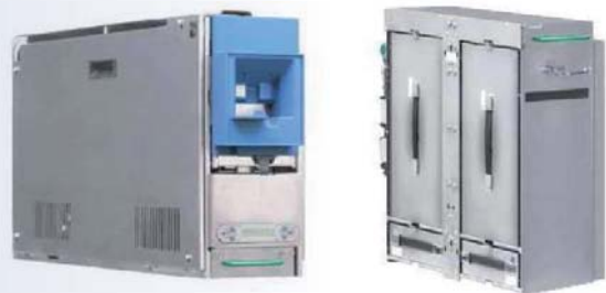
CTS CDM 10 Bündeleinzahlmodul