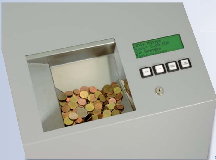
4-zeiliges LCD mit 4-Tasten Bedienung

Im Gegensatz zu der traditionellen Drehscheibenvereinzelung zeichnet sich diese bewährte Technik mit einer enorm erhöhten Unempfindlichkeit gegenüber eingeworfenen Fremdkörpern aus. Die innovative duale Sensortechnologie, die auf einer optischen und elektronischen Münzprüfung besteht, ist von zwei unabhängigen ECB Mitgliedsbanken fälschungsgeprüft.